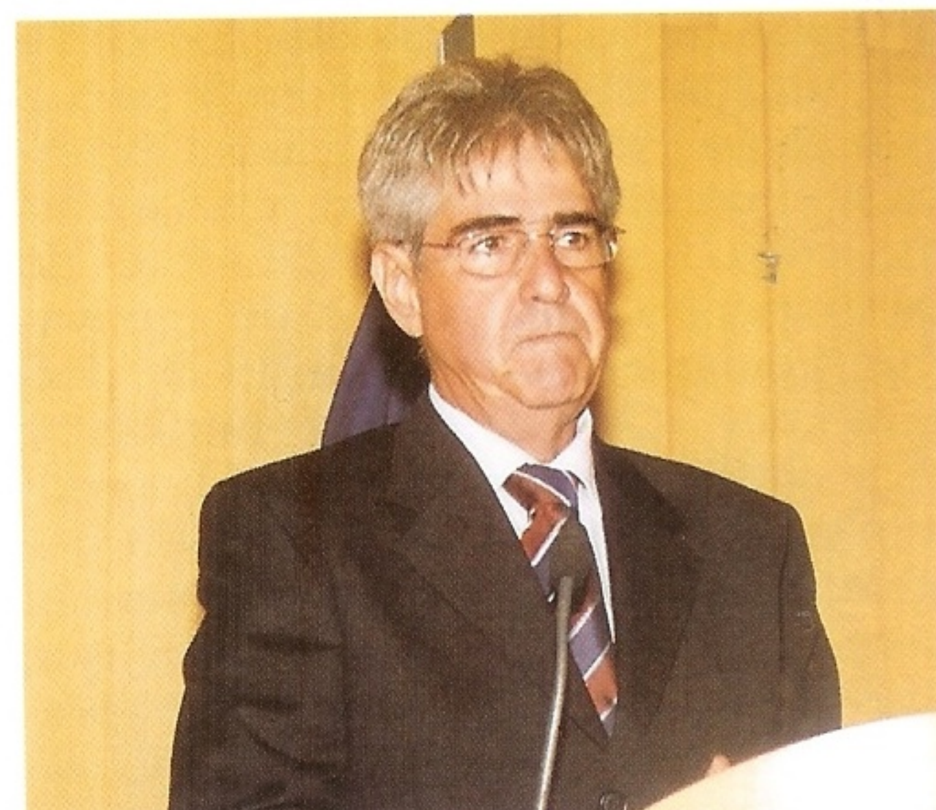
Prefeito Odelmo Leão Carneiro Sobrinho