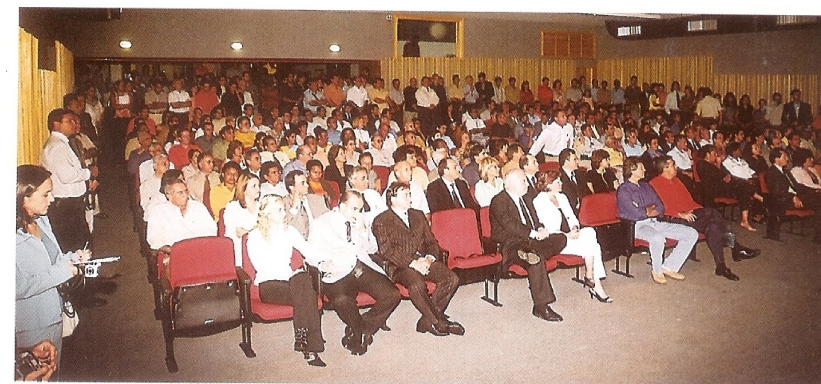
Convidados lotaram o auditório Cícero Diniz para a posse dos novos secretários municipais

Na área da educação, uma das prioridades é o atendimento da educação infantil, que de acordo com denúncia feita pelo Ministério Público e que já foi motivo até de ação judicial, há uma carência em torno de cinco mil vagas para crianças de zero a seis