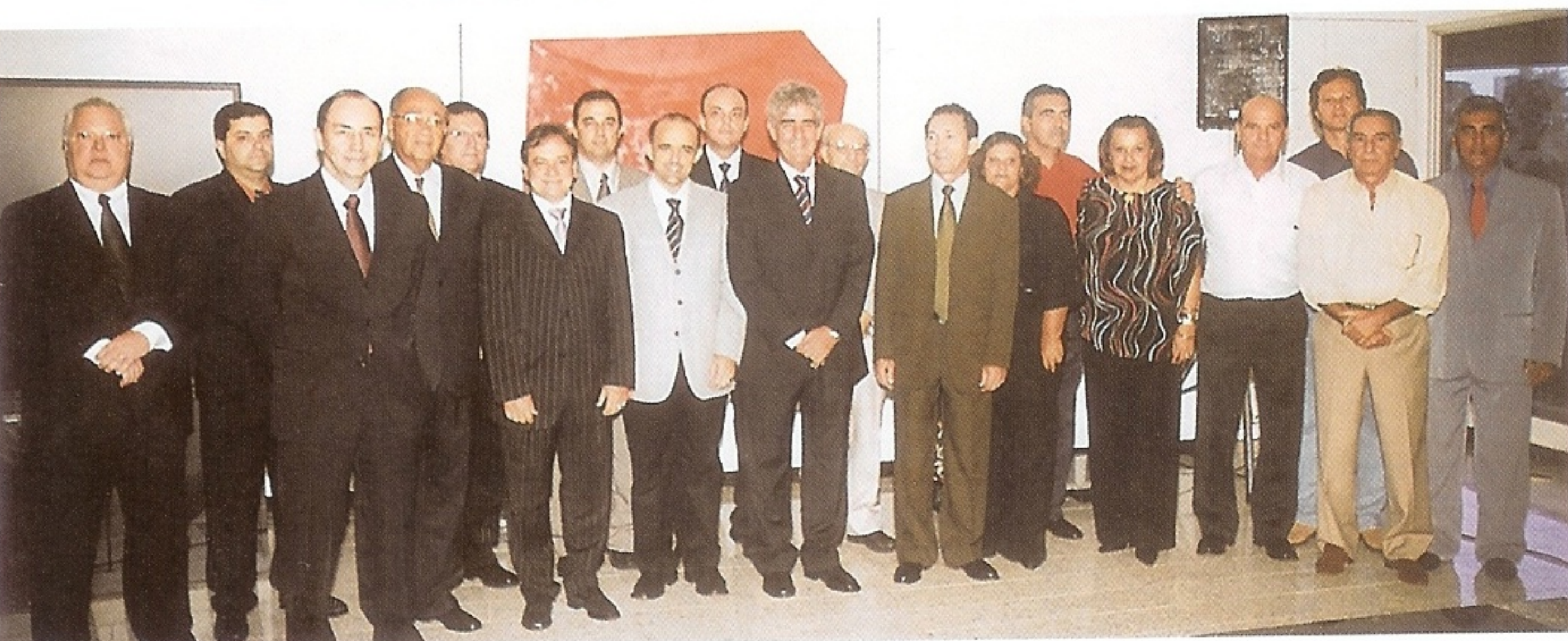
Prefeito e vice em pose especial para Dystak's com todo seu primeiro escalão do governo